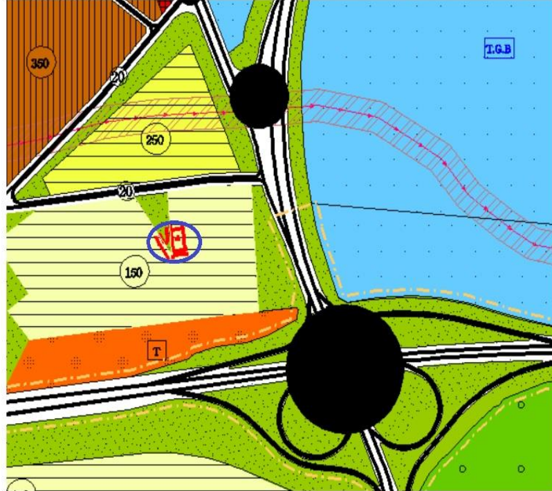
Onaylı 1/5000 Görükle Nazım Plan Örneği

17.04.2008 tarih ve 287 sayılı Bursa Büyükşehir Belediye Meclis Kararı ile onaylanan 1/5000 ölçekli Görükle Belediyesi Nazım İmar Planında, 5637 ada - 5 no lu parsel “ Konut Alanı ve 150 ki/ha ” düzenlenmiştir. Planlama alanı 675 m2 dir.