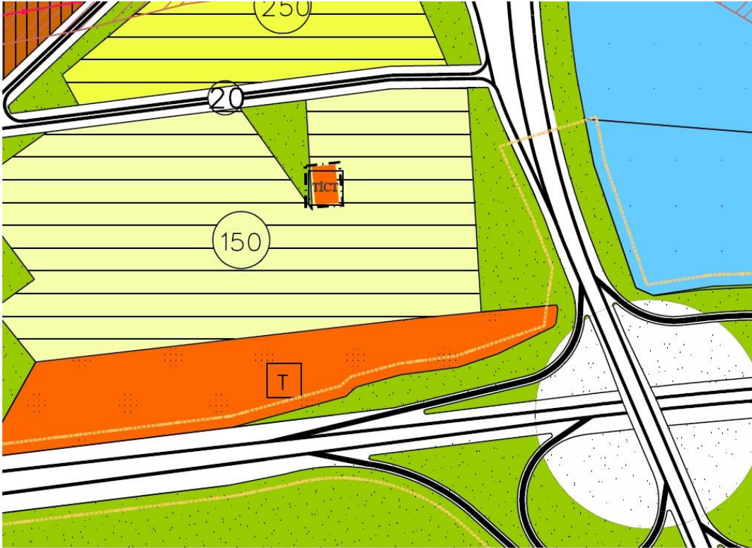
Görükle 1/5000 Ölçekli Nazım Plan Örneği

Nilüfer İlçesi, Görükle – Dumlupınar Mahallesi 5637 Ada – 5 Parsel öneri 1/5000 Ölçekli Nazım İmar Planı Değişiklik teklifinde “Ticaret - Turizm Alanı” olarak düzenlenmiştir. Parseldeki yapılaşma koşulları 1/1000 Ölçekli Uygulama İmar Planı Değişikliğinde belirlenecektir.